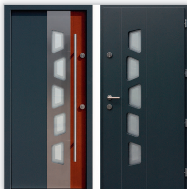
Drzwi wejściowe zewnętrzne model 451,1-451,21 systemu E-82. Wymiary zewnętrzne ościeżnicy [cm]: 98/209. Grubość [mm]: 82. Wyposażenie: zamek listwowy klasy „C” na dwie wkładki, 4 kołki antywłamaniowe. Szklenie: pakiet 3 szybowy z szybą niskoemisyjną P1. Materiał: klejone warstwowo drewno mahoń-meranti. Ocieplenie [mm]: 58. Współczynnik przenikania ciepła U_d [W/(m 2 K)]: 0,7. Gwarancja: 4 lata.