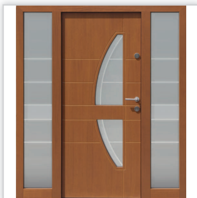
Drzwi wejściowe zewnętrzne model 445,11 z opcjonalnymi dostawkami bocznymi w wspólnej ramie. Grubość [mm]: 82. Wysokość ościeżnicy 209. Szerokość całej zabudowy od 140 do 250 cm. Wyposażenie: zamek listwowy klasy „C” na dwie wkładki, 4 blokady antywłamaniowe. Szklenie: pakiet 3 szybowy z szybą niskoemisyjną P1. Materiał: klejone warstwowo drewno mahoń-meranti. Ocieplenie [mm]: 58. Współczynnik przenikania ciepła U_d [W/(m 2 K)]: 0,7. Gwarancja: 4 lata.