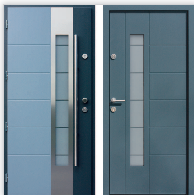
Drzwi wejściowe zewnętrzne model 471,2-471,12 systemu E-82. Wymiary zewnętrzne ościeżnicy [cm]: 98/209. Grubość [mm]: 82. Wyposażenie: zamek listwowy klasy „C” na dwie wkładki, 4 kołki antywłamaniowe. Szklenie: pakiet 3 szybowy z szybą niskoemisyjną P1. Materiał: klejone warstwowo drewno mahoń-meranti. Ocieplenie [mm]: 58. Współczynnik przenikania ciepła U_d [W/(m 2 K)]: 0,7. Gwarancja: 4 lata.