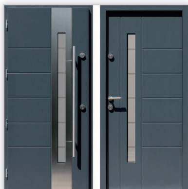
Drzwi wejściowe zewnętrzne model 475,4-475,14 systemu E-82. Wymiary zewnętrzne ościeżnicy [cm]: 98/209. Grubość [mm]: 82. Wyposażenie: zamek listwowy klasy „C” na dwie wkładki, 4 kołki antywłamaniowe. Szklenie: pakiet 3 szybowy z szybą niskoemisyjną P1. Materiał: klejone warstwowo drewno mahoń-meranti. Ocieplenie [mm]: 58. Współczynnik przenikania ciepła U_d [W/(m 2 K)]: 0,7. Gwarancja: 4 lata.