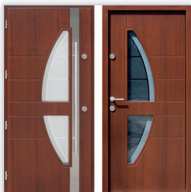
Drzwi wejściowe zewnętrzne model 445,4-445,14 systemu E-82. Wymiary zewnętrzne ościeżnicy [cm]: 98/209. Grubość [mm]: 82. Wyposażenie: zamek listwowy klasy „C” na dwie wkładki, 4 kołki antywłamaniowe. Szklenie: pakiet 3 szybowy z szybą niskoemisyjną P1. Materiał: klejone warstwowo drewno mahoń-meranti. Ocieplenie [mm]: 58. Współczynnik przenikania ciepła U_d [W/(m 2 K)]: 0,7. Gwarancja: 4 lata.