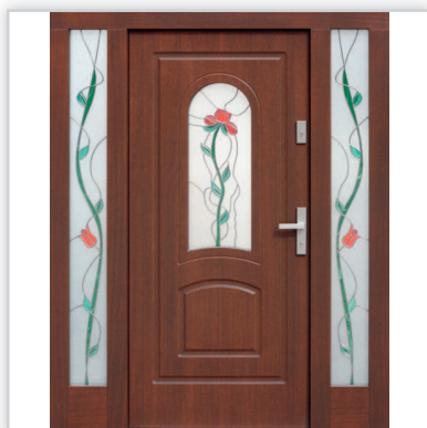
Drzwi wejściowe zewnętrzne model 576s1 z opcjonalnymi dostawkami bocznymi w wspólnej ramie. Grubość [mm]: 82. Wysokość ościeżnicy 209. Szerokość całej zabudowy od 140 do 250 cm. Wyposażenie: zamek listwowy klasy „C” na dwie wkładki, 4 blokady antywłamaniowe. Szklenie: pakiet 3 szybowy z szybą niskoemisyjną P1. Materiał: klejone warstwowo drewno mahoń-meranti. Ocieplenie [mm]: 58. Współczynnik przenikania ciepła U_d [W/(m 2 K)]: 0,7. Gwarancja: 4 lata.