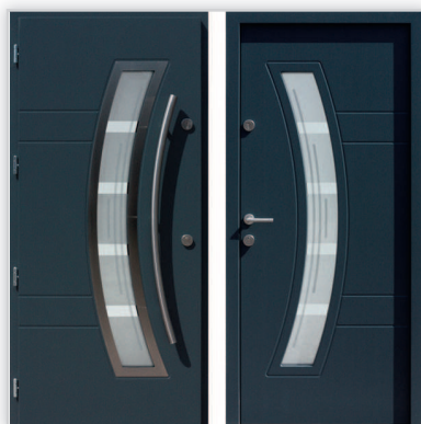
Drzwi wejściowe zewnętrzne model 447,1-447,11 systemu E-82. Wymiary zewnętrzne ościeżnicy [cm]: 98/209. Grubość [mm]: 82. Wyposażenie: zamek listwowy klasy „C” na dwie wkładki, 4 kołki antywłamaniowe. Szklenie: pakiet 3 szybowy z szybą niskoemisyjną P1. Materiał: klejone warstwowo drewno mahoń-meranti. Ocieplenie [mm]: 58. Współczynnik przenikania ciepła U_d [W/(m 2 K)]: 0,7. Gwarancja: 4 lata.