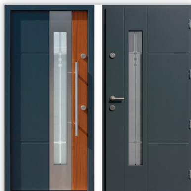
Drzwi wejściowe zewnętrzne model 449,1 systemu E-82. Wymiary zewnętrzne ościeżnicy [cm]: 98/209. Grubość [mm]: 82. Wyposażenie: zamek listwowy klasy „C” na dwie wkładki, 4 kołki antywłamaniowe. Szklenie: pakiet 3 szybowy z szybą niskoemisyjną P1. Materiał: klejone warstwowo drewno mahoń-meranti. Ocieplenie [mm]: 58. Współczynnik przenikania ciepła U_d [W/(m 2 K)]: 0,7. Gwarancja: 4 lata.